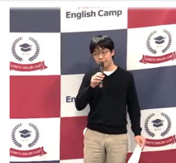
今年度の参加学生